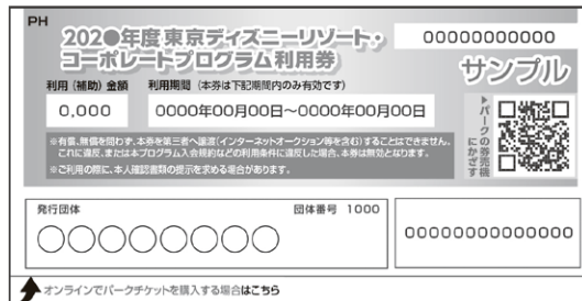
コーポレートプログラム利用券

利用券に記載されている利用(補助)金額分が、パークチケット価格や ディズニーホテル宿泊費から差し引かれる形でご利用できます。